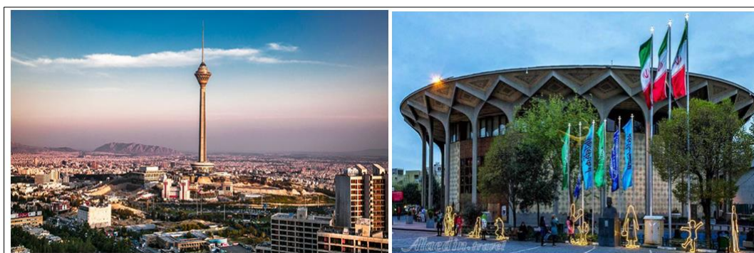
شکل (۳). جاذبه‌های شهر تهران (سمت راست: تصویر تئاتر شهر؛ سمت چپ: تصویر برج میلاد)