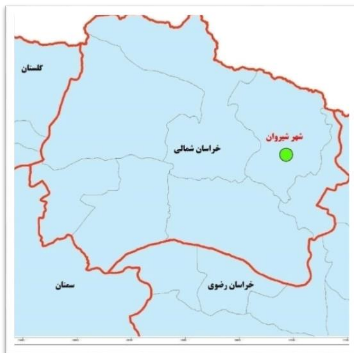
شکل (۱). موقعیت محدوده مورد مطالعه