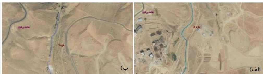
شکل (۱۰). الف) تصویر هوایی مسیر بازه ۸. ب) تصویر هوایی مسیر بازه ۹.

بازه ۹ از کنار جاده وردیج شروع شده و تا ابتدای رشته کوه البرز امتداد دارد. از نظر شاخص عملکردی در این بازه تغییرات قابل ملاحظه‌ای در پیوستگی طولی وجود دارد که از عبور سیلاب جلوگیری می‌کند و اشکال بستری سازگار با شیب دره هستند و دیواره‌ای در اطراف رودخانه وجود ندارد و رسوبات ریزدانه فراوان در بخش‌های مختلفی از بازه وجود دارد و از نظر شاخص مصنوعی دارای تغییرات جریان و تغییرات دبی مشخصی می‌باشد و تغییرات مصنوعی در کمتر از ۱۰ درصد طول بازه وجود دارد و از نظر شاخص تعدیل کانال در بازه مورد ارزیابی عدم وجود تغییرات در الگوی کانال، تغییرات محدود در عرض کانال و تغییرات ناچیز در سطح اساس بستر وجود دارد. بازه ۹ از نظر کیفیت مورفولوژیکی (MQI) دارای امتیاز ۰/۶ و کیفیت متوسط می‌باشد. امکانات موجود در این بازه شامل: وجود توپوگرافی مناسب جهت احداث سد تأخیری و کاهش ریسک سیلاب، عدم وجود ساخت‌وسازهای غیرمجاز و کاربری‌های ناسازگار، امکان تأمین آب پایه و تغذیه آبخوان، عبور جاده وردیج به‌عنوان یک معبر شریانی از ضلع غربی بازه می‌باشد. با توجه به امکانات موجود در خصوص بازه شماره ۹ انتظار می‌رود که رودخانه و همچنین اراضی بکر و چشم‌اندازهای طبیعی موجود تا حد امکان حفاظت شوند و جهت جلوگیری از تخریب این ویژگی‌های ارزنده، باید با ایجاد پهنه حفاظتی با غلبه فعالیت‌های تفرجگاهی نسبت به بهره‌گیری از امکانات موجود بهره جست. در این حین توجه به ایمنی و امنیت رودخانه در این بازه به‌عنوان بازه بالادست رودخانه از اهمیت فراوانی برخوردار است اشکال (۱۰ ب، ۱۱ ب).