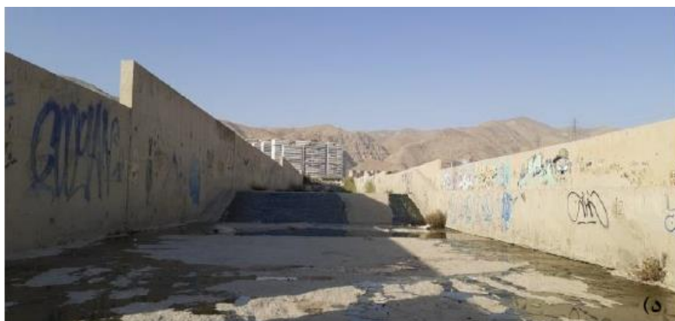
شکل (۳). نمونه‌هایی از تغییرات در بستر رودخانه: الف) محافظ کرانه به صورت دیواره بتنی. ب) پایه‌های پل دانش در مسیر رودخانه. ج) پایه‌های پل بزرگراه شهید خرازی در مسیر رودخانه. د) کانال کشی بتنی در کف و کناره رودخانه.

شرایط بازه‌ها بر اساس شاخص کیفی مورفولوژیک رود به صورت زیر تشریح می‌شود: