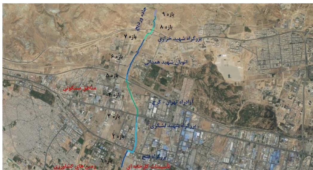
شکل (۲). موقعیت بازه‌های رودخانه و تقاطع با اتوبان‌ها و کاربری اراضی حاشیه آن