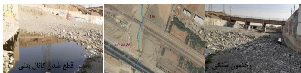
شکل (۸). تصاویر هوایی و میدانی مسیر بازه ۵

بازه ۶ از بالای خط متروی تهران- کرج شروع شده و تا بعد از اتوبان شهید همدانی امتداد دارد و بازه ۷ نیز از نرسیده به اتوبان شهید خرازی شروع شده و تا بعد از آن امتداد دارد. از نظر شاخص عملکردی در بازه‌های ۶ و ۷ پیوستگی طولی با تغییرات کم وجود دارد که جلوی عبور سیلاب را نمی‌گیرد و به دلیل وجود بستر مصنوعی دگرگونی کامل اشکال بستر و همچنین تغییرات رسوبات گسترده به صورت رخنمون‌های سنگی مشاهده می‌شود و همچنین دارای کانال به صورت دیواره بتنی می‌باشد و از نظر شاخص مصنوعی تغییرات جریان و تغییرات دبی قابل ملاحظه می‌باشد و همچنین تغییرات مصنوعی در مسیر رودخانه وجود دارد و از نظر شاخص تعدیل کانال در بازه‌های مورد ارزیابی تغییر الگوی کانال مشابه و تغییرات متوسط در عرض کانال و تغییرات محدود در سطح اساس بستر وجود دارد. بازه ۶ و ۷ از نظر کیفیت مورفولوژیکی (MQI) دارای امتیاز ۰/۲ و کیفیت خیلی ضعیف می‌باشد. در بازه ۷ با توجه به خطرات ناشی از وقوع سیلاب به دلیل تغییرات حریم و بستر و استقرار پل‌های بزرگراه شهید خرازی در حریم و بستر رودخانه، تأمین ایمنی پایه‌های پل به همراه ایجاد فضاهای سبز حائل بین رودخانه و شبکه بزرگراهی مهم‌ترین رویکردی است که در بازه شماره ۷ می‌توان لحاظ نمود شکل (۹).