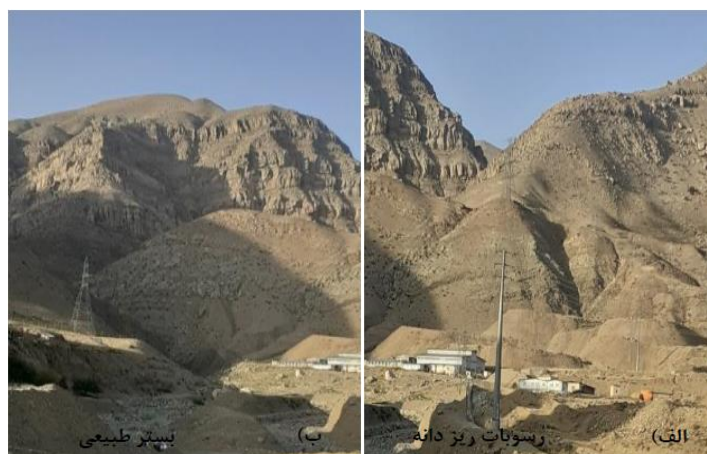
شکل (۱۱). الف) تصویر میدانی مسیر بازه ۸. ب) تصویر میدانی مسیر بازه ۹.

و مهم‌تر از همه که باعث شده است این دو بازه (بازه‌های ۸ و ۹) دارای کیفیت مورفولوژیکی متوسط باشند عدم وجود تغییرات مصنوعی و دخل و تصرفات انسانی در حریم این بخش از رودخانه می‌باشد.