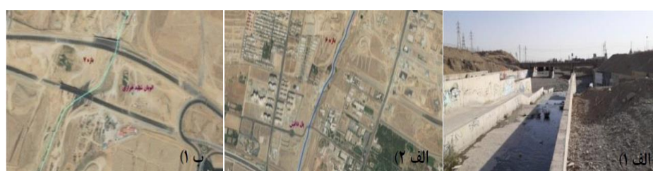
شکل (۹). (الف ۱ و ۲): تصاویر میدانی و هوایی مسیر بازه ۶. ب ۱) تصویر هوایی مسیر بازه ۷.

بازه ۶ از بالای خط متروی تهران- کرج شروع شده و تا بعد از اتوبان شهید همدانی امتداد دارد و بازه ۷ نیز از نرسیده به اتوبان شهید خرازی شروع شده و تا بعد از آن امتداد دارد. از نظر شاخص عملکردی در بازه‌های ۶ و ۷ پیوستگی طولی با تغییرات کم وجود دارد که جلوی عبور سیلاب را نمی‌گیرد و به دلیل وجود بستر مصنوعی دگرگونی کامل اشکال بستر و همچنین تغییرات رسوبات گسترده به صورت رخنمون‌های سنگی مشاهده می‌شود و همچنین دارای کانال به صورت دیواره بتنی می‌باشد و از نظر شاخص مصنوعی تغییرات جریان و تغییرات دبی قابل ملاحظه می‌باشد و همچنین تغییرات مصنوعی در مسیر رودخانه وجود دارد و از نظر شاخص تعدیل کانال در بازه‌های مورد ارزیابی تغییر الگوی کانال مشابه و تغییرات متوسط در عرض کانال و تغییرات محدود در سطح اساس بستر وجود دارد. بازه ۶ و ۷ از نظر کیفیت مورفولوژیکی (MQI) دارای امتیاز ۰/۲ و کیفیت خیلی ضعیف می‌باشد. در بازه ۷ با توجه به خطرات ناشی از وقوع سیلاب به دلیل تغییرات حریم و بستر و استقرار پل‌های بزرگراه شهید خرازی در حریم و بستر رودخانه، تأمین ایمنی پایه‌های پل به همراه ایجاد فضاهای سبز حائل بین رودخانه و شبکه بزرگراهی مهم‌ترین رویکردی است که در بازه شماره ۷ می‌توان لحاظ نمود شکل (۹).