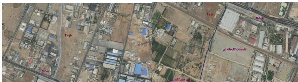
شکل (۵). تصویر هوایی مسیر بازه ۲