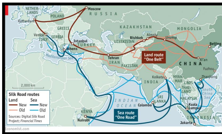
شکل (۳). ایران و کریدورهای بین‌المللی

ایران نگرانی‌های عمده‌ای در مورد جاه‌طلبی‌های ترانزیتی عراق و همکاری این کشور با چین دارد، از تضعیف احتمالی موقعیت خود در تجارت ترانزیتی گرفته تا اینکه بندر خرمشهر در نزدیکی ایران از موقعیت جغرافیایی مشابه فاو برخوردار نیست. همگی این مسائل انزوای بین‌المللی ایران و تأثیر تحریم‌ها بر این کشور را نشان می‌دهد (عزتی، هادی زاده، ۱۳۹۳: ۱-۱۲). پروژه بندر فاو فرصت‌های زیادی را برای عراق فراهم می‌کند تا نقش خود را در ترانزیت منطقه‌ای و موقعیت جغرافیایی خود را به طور گسترده تقویت کند. برای انجام این کار، ابتدا باید به چالش‌های داخلی مانند فساد و اختلافات سیاسی و چالش‌های خارجی مانند رقابت سرمایه‌گذاری بین چین و ایالات متحده بپردازد. با نگاهی به منطقه، به نظر می‌رسد پروژه‌هایی مانند فاو برای برخی از کشورها مانند ایران یک تهدید است، در حالی که احتمالاً به نفع برخی دیگر مانند ترکیه، قطر و سوریه است. علیرغم پتانسیل قابل توجهی که برای عراق وجود دارد، چه از نظر اقتصادی و چه از نظر سیاسی، غلبه بر چالش‌های مرتبط آسان نخواهد بود.