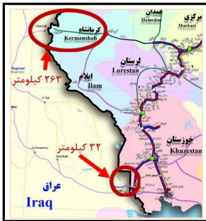
شکل ۶-مسیر ترانزیتی کرمانشاه _ بغداد

در عوض شلمچه_بصره، ایران می‌توانست راه آهن کرمانشاه_بغداد را از مسیر قصرشیرین-خانقین راه اندازد چراکه دسترسی به پایتخت در کشوری ازهم‌گسیخته امری است خردمندانه. همچنین، ایران می‌توانست با توسعه خط سنندج_سلیمانیه از مرز باشماق، دسترسی زمینی ایمن به بازار کردستان عراق داشته باشد شکل (۶).