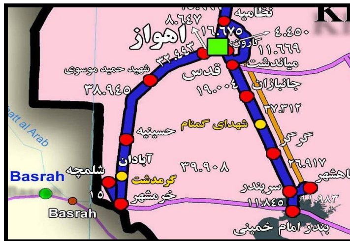
شکل (۵). مسیر ترانزیتی شلمچه_بصره

در عوض شلمچه_بصره، ایران می‌توانست راه آهن کرمانشاه_بغداد را از مسیر قصرشیرین-خانقین راه اندازد چراکه دسترسی به پایتخت در کشوری ازهم‌گسیخته امری است خردمندانه. همچنین، ایران می‌توانست با توسعه خط سنندج_سلیمانیه از مرز باشماق، دسترسی زمینی ایمن به بازار کردستان عراق داشته باشد شکل (۶).