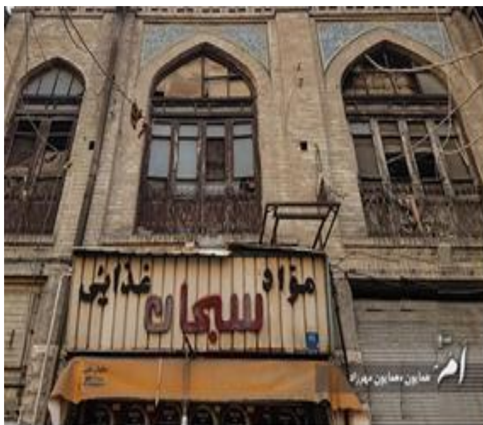
شکل (۳). نمونه‌هایی از اقدامات انسانی آسیب‌رسان در بافت تاریخی محله بهارستان