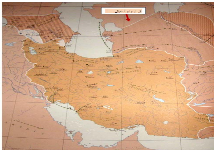
شکل (۱) نقشه سرزمین‌های جدا شده از ایران طبق قرارداد آخال (آخال - تکه) (موسسه جغرافیای دانشگاه تهران، ۱۳۵۰: ۲۸)

سال‌های ۱۸۷۳ تا ۱۸۸۱ علاوه بر اشغال خوارزم، ایلات ترکمن را نیز شکست داده بودند و سرزمین ترکمن‌های تکه را با نام «سرزمین ماورای خزر» به خاک خود ملزم کردند. با این پیمان ناصرالدین‌شاه حکومت روسیه را بر این مناطق به رسمیت شناخت و ایران و روسیه برای اولین بار در ناحیه شرق دریای خزر با یکدیگر همسایه شدند. پیمان آخال تأثیر دوگانه‌ای بر ایران داشت. از یک سو ایران تا حدی از یورش‌های ترکمن‌ها رهایی می‌یافت اما این امر به بهای گران از دست رفتن سرزمین‌هایی به دست آمد که ناصرالدین‌شاه ادعای سلطنت بر آنها داشت (میرحیدر، ۱۳۵۶: ص ۱۸۵). این پیمان همچنین به ضرر ایلات و عشایر ترکمن‌ها بود و با مصالح سنتی قوم ترکمن هم‌خوانی نداشت. میان آنان مرز کشی شده و در دو کشور جداگانه قرار می‌گرفتند و اتحاد آنان به هم می‌خورد. یموت‌های ایران که بر اساس موافقت‌نامه دو دولت هر سال برای چراندن گله‌های خود به آن سوی مرز کوچ می‌کردند باید به هر دو دولت مالیات می‌دادند و این موضوع مقامات روسی و ایرانی را در جمع‌آوری مالیات دچار مشکل کرده بود.