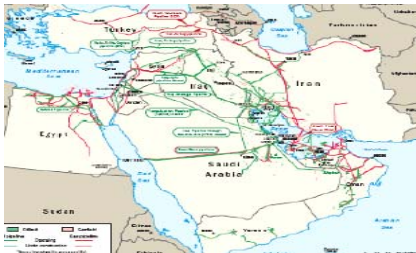
شکل (۲) نقشه خطوط لوله نفت و گاز در خلیج فارس

یکی از مناسب ترین و اقتصادی ترین روش های انتقال گاز طبیعی در حال حاضر، انتقال بوسیله خط لوله می باشد که هم اکنون قسمت اعظم انتقال گاز جهان از این طریق صورت می گیرد. بطوری که در پایان سال ۲۰۱۰ از مجموع ۹۷۵/۲۲ میلیارد متر مکعب گاز مبادله شده، ۶۷۹/۵۹ میلیارد متر مکعب آن از طریق خط لوله بوده است (Bp Statistical Review of World Energy, ۲۰۱۱: ۲۸). در منطقه خلیج فارس نیز هرچند که هم اکنون خطوط لوله گازی بین مرزی، به ندرت وجود دارد اما قراردادهای عمده ای بین کشورهای منطقه جهت انتقال گاز از طریق خط لوله بسته شده است که بعضی از آنها اجرایی شده اند. (شکل ۲)