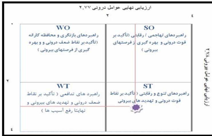
شکل (۲) ماتریس نمرة نهایی ارزیابی عوامل داخلی و خارجی