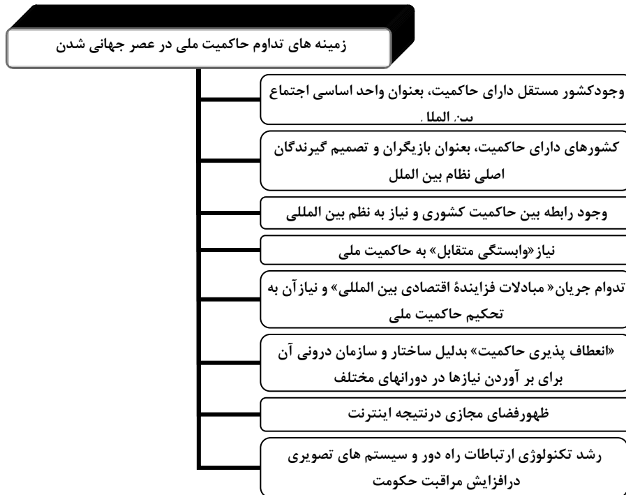
شکل (۲) زمینه های تداوم حاکمیت ملی در عصر جهانی شدن (ترسیم از: نگارندگان)

همچنین، برخی مانند «تامسون» و «کراسنر» با زیر سوال بردن این ادعا که «وابستگی متقابل»، حاکمیت را تهدید می کند، استدلال می کنند که وابستگی متقابل به جای تهدید حاکمیت، خود نیازمند آن است. حکومت هایی دارای حاکمیت هستند که به تضمین و تثبیت حقوق مالکیت می پردازند و این خود، از شرایط لازم برای جریان بین المللی کالا و سرمایه است. مطابق با این استدلال، تحکیم حاکمیت خود از شرایط لازم برای جریان یافتن مبادلات فزاینده اقتصادی بین المللی است (Thomson and krasner, 1989: 197-198). «تامسون و کراسنر»، بر این اساس، هر گونه امکان بالقوه برای دگرگونی ساختاری عمده را که از پایین در رژیم حاکمیت رخ دهد، رد می کنند (Thomson and krasner, 1989: 216)، زیرا که وابستگی متقابل پیوسته نیازمند «تداوم» رژیم حاکمیت برای حفظ و پیگیری خود است. «کراسنر» در جای دیگر نیز همین استدلال اصلی را با تفصیلی بیشتر تکرار می کند. به نظر وی شواهد و سابقه تاریخی بسیار پیچیده تر از آن است که با تصور رایج درباره تهدید کنترل موثر حکومتی از جانب وابستگی متقابل مطابقت کند. بدین معنی که، کنترل موثر حکومتی به هر حال در