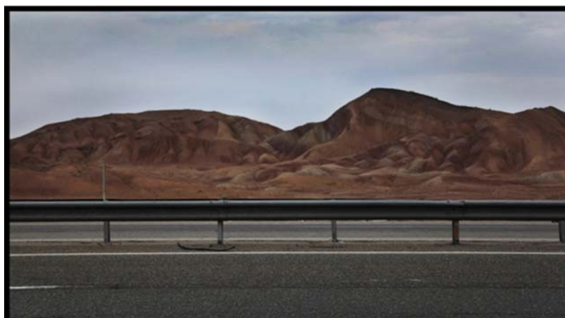
شکل (۵) گنبد نمکی نامنظم در مجاورت آزادراه قم- کاشان

جاذبه ها و قابلیت های گردشگری: آشنایی عموم گردشگران با پدیده های ژئومورفولوژیک و لندفرم های حاصل از تکتونیک نمکی نظیر پدیده ی پای پینگ و غیره؛ جاذبه های آموزشی (تخصصی) در زمینه ی شناخت تکتونیک، ماگماتیسم، ژئومورفولوژی ساختمانی و غیره.