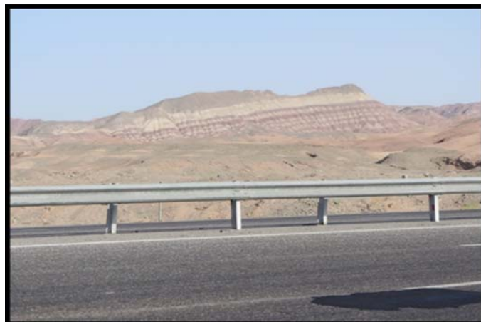
شکل (۲) اشکال چین خورده ترشیاری در تشکیلات تبخیری