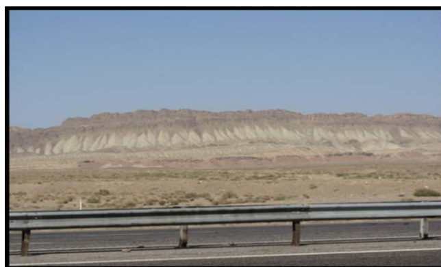
شکل (۳) بدلند و شیب های واریزه ای پیوسته در مجاورت آزاد راه قم - کاشان

جاذبه ها و قابلیت های گردشگری: جاذبه های آموزشی از منطقه علاوه بر مشاهده ی زیبایی چشم اندازها، در زمینه شناسخت فرایندهای دامنه ای از نمونه توان های ژئومورفوتوریستی این سایت می باشد.