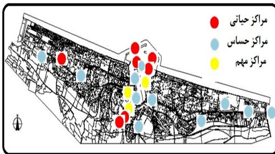
شکل (۳) نحوه پراکنش مراکز ثقل شهر بر اساس روش جدول ارزیابی

پس از تعیین مراکز استراتژیک توزیع فضایی و پراکندگی جغرافیایی آنها مورد بررسی قرار گرفت تا بخش هایی از شهر که واجد بیشترین کاربری های استراتژیک و نیز آسیب پذیری بیشتری هستند شناسایی شوند. این اطلاعات به صورت نقشه در شکل ۳ قابل مشاهده است.