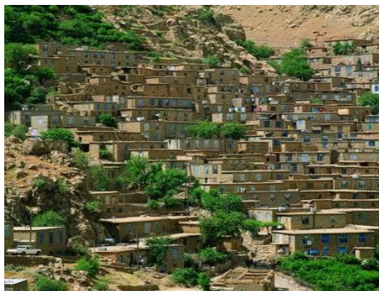
شکل (۲) نمای عمومی روستای هجیج

محدوده مطالعه در این تحقیق، روستای هجیج از توابع بخش نوسود شهرستان پاوه در استان کرمانشاه است که در ۳۴ کیلومتری شهر پاوه و ۱۲۳ کیلومتری کرمانشاه قرار دارد. این روستا دارای ۱۸۰ خانوار، معادل ۶۰۳ نفر جمعیت است (مرکز آمار ایران، ۱۳۹۰) که از شمال غرب و جنوب به کوه‌های سالان و شاهو محدود است که با اقلیمی معتدل و کوهستانی، در بهار و تابستان آب و هوای مطبوعی دارد و در پاییز و زمستان سرد است. اگرچه اسناد معتبری در مورد تاریخ روستای هجیج در دست نیست، اما وجود امامزاده عبیدالله معروف به کوسه هجیج بیانگر آن است که این روستا سابقه تاریخی دیرینه‌ای دارد و قدمت آن به بیش از ۵۰۰ سال می‌رسد. جاذبه‌های گردشگری این روستا ترکیبی از میراث طبیعی و فرهنگی از جمله شامل چشم‌اندازهای کوهستانی و سبز پیرامون روستا، رودخانه دایمی، بافت کالبدی روستا با معماری پله‌کانی، مصالح ساختمانی بوم‌آورد، ویژگی‌های مردم‌شناختی مانند آیین‌ها و آداب کردی، پوشش سنتی مردان و زنان، صنایع دستی خاص نظیر گیوه‌بافی و ... است (شکل ۲).