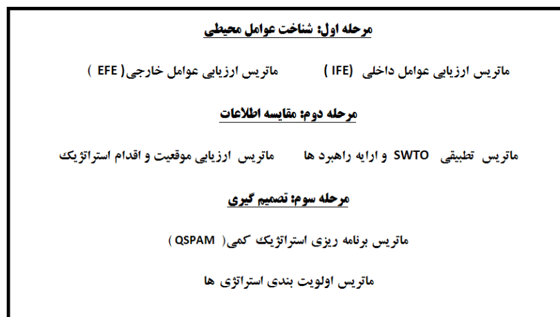
شکل (۱). روش شناسی و چهارچوب تحلیلی برنامه ریزی استراتژیک

این پژوهش با استفاده از روش شناسی توصیفی و تحلیلی و از طریق مطالعات اسنادی و میدانی انجام پذیرفته است. همچنین در پژوهش حاضر روش جمع آوری اطلاعات اسنادی بصورت مراجعه و فیش برداری از مدارک و اسناد کتابخانه‌ای و همچنین در مطالعات میدانی از روش نمونه برداری (روش کوکران)، مشاهده مستقیم، مصاحبه، تهیه عکس، فیلم و برای تجزیه و تحلیل اطلاعات از تکنیک استراتژیک SWOT و نرم افزارهای SPSS و EXCEL استفاده شده است. جامعه آماری مورد مطالعه در این مقاله را خبرگان و مسئولان دستگاهها و نهادهای مرتبط با گردشگری شهری تشکیل می دهند که تعداد ۷۰ نفر بعنوان نمونه انتخاب شده است. سپس باتوجه به تحلیل عوامل چهارگانه قوت، ضعف، تهدیدات و فرصت ها، پرسشنامه ای حاوی ۲۰ پرسش پنج گزینه ای به دست آمد در این بخش برای تکمیل پرسشنامه ها از ۷۰ نفر از خبرگان و مسئولان دستگاهها و نهادهای مرتبط با گردشگری شهر مورد مطالعه کسب نظر انجام شد. پرسش ها بر اساس طیف لیکرت شامل ۵ گزینه خیلی زیاد - زیاد - متوسط - کم و خیلی کم بود. جهت تجزیه و تحلیل اطلاعات و ارائه الگوی راهبردی توسعه توریسم شهری از روش تحلیلی SWOT استفاده شده است که در ابتدا با سنجش محیط داخلی و محیط خارجی شهر فهرستی از نقاط قوت، ضعف، فرصتها و تهدیدات مورد شناسایی قرار گرفت و سپس بوسیله نظر خواهی از خبرگان و مسئولان امر و وزن دهی به هرکدام از این مسائل و سپس محاسبه و تحلیل آنها، اولویت ها مشخص شد و جهت برطرف نمودن یا تقلیل نقاط ضعف و تهدیدها و تقویت و بهبود نقاط قوت و فرصتهای موجود در ارتباط با گسترش گردشگری شهری در شهر شهرکرد، در نهایت استراتژی های مناسبی ارائه شده است. مراحل شناسایی، ارزیابی و وزن دهی به عوامل چهارگانه در تحلیل SWOT عبارتند از شکل (۱):