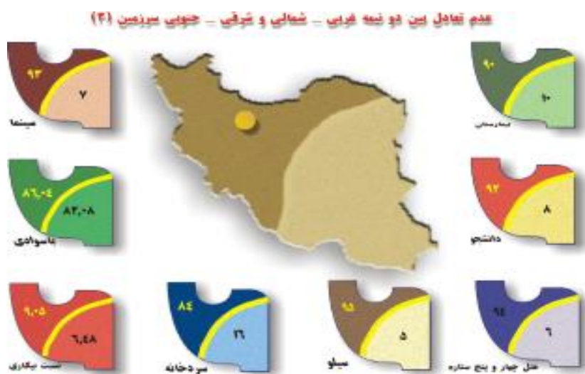
شکل (۲): نابرابری در مناطق مختلف کشور

سطوح توسعه یافتگی استانهای کشور از ۱۳۴۵ تا ۱۳۹۰