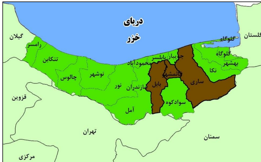
شکل (۱). موقعیت محدوده مورد مطالعه