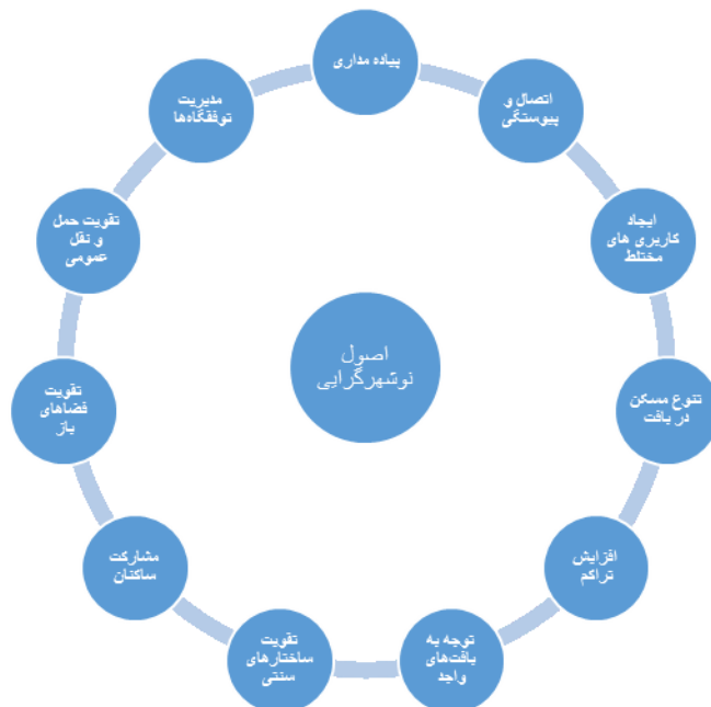
شکل (۱). اصول نوشهر گرایی.