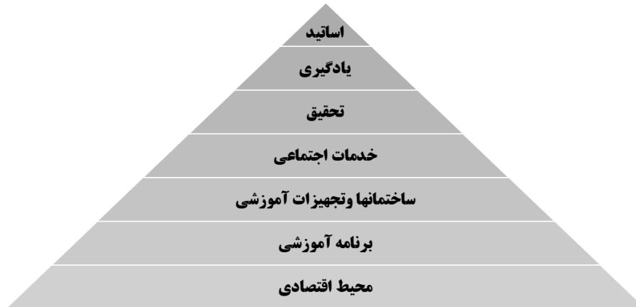
شکل (۱). ابعاد کیفیت خدمات آموزشی