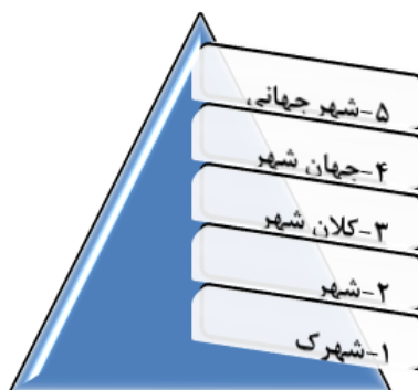
شکل (۱). انواع و مراحل تکامل شهر،