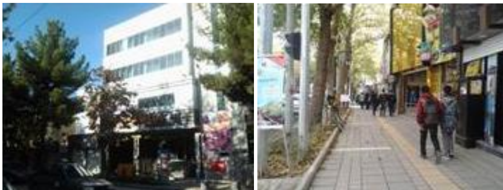
شکل (۳). تقسیم بنا به احجام متناسب با دانه بندی بخش تاریخی شهر

طرح و اجرای بناهای واقع در مناطق تاریخی شهر باید دارای مقیاس انسانی بوده و دانه بندی و ریخت شناسی مشابه بافت تاریخی شهر داشته باشد. در طراحی معماری بناهای کلان مقیاس، تقسیم بنا به احجام متناسب با دانه بندی بخش تاریخی شهر الزامی است.