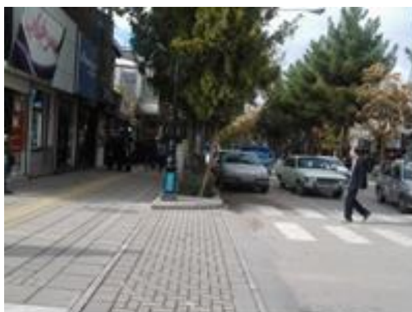
شکل (۶) اختلاف سطح (لبه، پله، سکو و ...) در مسیر عبور در معابر پیاده

ایجاد هرگونه اختلاف سطح (لبه، پله، سکو و ...) در مسیر عبور در معابر پیاده ممنوع است و تغییرات سطوح بایستی بوسیله شیب راهه و رمپ انجام شود. شکل (۶).