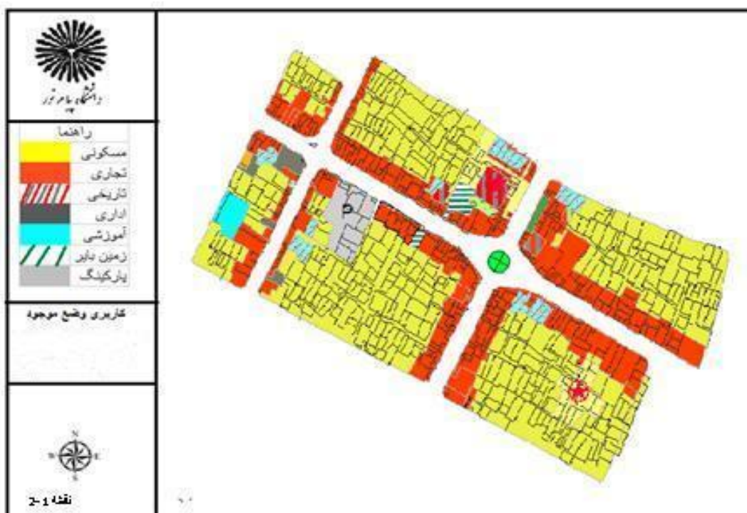
شکل (۱) بررسی کاربری‌های محدوده مورد مطالعه

ابتدا با استفاده از روش اسنادی و ابزارهای همچون کتاب‌ها، مقالات، مجلات و ... به گردآوری اطلاعات مربوط به محدوده مورد مطالعه پرداخته و سپس با استفاده از روش غیر اسنادی (میدانی)، بازدید میدانی و تهیه عکس به تجزیه و تحلیل وضع موجود و ارائه راهکارهای مناسب پرداخته شد. سپس شاخص‌های کیفیت محیطی بررسی و تحلیل شده است، تا با تأکید بر ابعاد فرهنگی اجتماعی، به تأثیر پیاده راه بر تعاملات اجتماعی با استفاده از برداشت‌های میدانی و مصاحبه با ساکنان به جمع‌آوری داده‌ها پرداخته شده است.