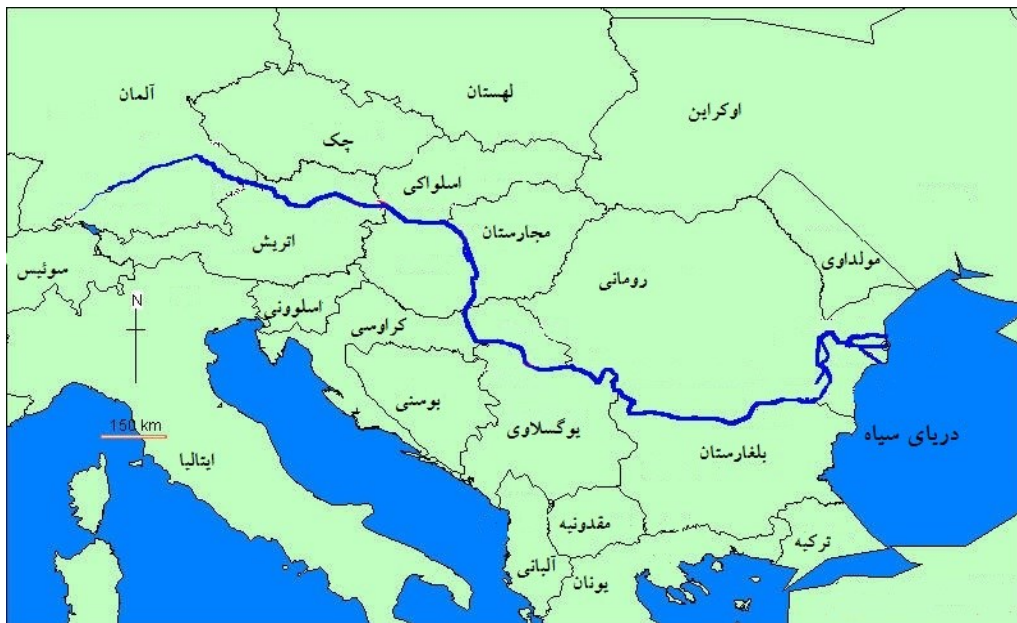
شکل (۲). موقعیت رودخانه دانوب در قاره اروپا

است (ووکویچ، ۲۰۱۴: ۳۲۵). از سویی بهبود وضعیت کانال کشتیرانی دانوب که امروزه به وسیله کانال به «ماین» و از آنجا به «راین» می‌پیوندد به این رود اجازه می‌دهد که به شاهره کشتیرانی مهمی تبدیل شود که دریای شمال را به دریای سیاه متصل می‌کند (محمدعلی پور، ۱۳۹۴: ۱). شکل (۲).