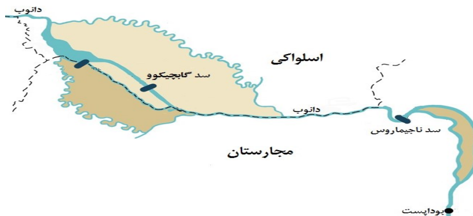
شکل (۳). موقعیت سد‌های گابچیکوو-ناگیماروس بر روی رودخانه دانوب

اسلواک‌ها مسیر دانوب را از طریق یک کانال به نیروگاه "گابچیکوو" منحرف کردند. اقدامی که موجب شد بستر اصلی دانوب در خاک مجارستان یک‌باره ۹۰ تا ۹۵ درصد از آب خود را از دست بدهد. به‌طوری که تیرک‌های شاخص سطح آب، در خشکی قرار گرفت و سطح سفره‌های آب زیرزمینی دو-سه متر افت کرد (مولدوا، ۱۳۸۴: ۲۶). مجارهای تندروها از انفجار سد سخن راندند که به احتمال قوی باعث جنگ می‌شد که در این میان اتحادیه اروپا پیشنهاد میانجی‌گری داد. بر پایه برآوردها منفعت اتحادیه اروپا برای مداخله در این قضیه در ثبات منطقه نهفته بود. اتحادیه اروپا که نگران تکرار وقایع بالکان در این منطقه بود و بیم این می‌رفت که با آغاز درگیری افزون بر دخالت قدرت‌های فرامنطقه‌ای، ناامنی به کل منطقه بگسترده، پیشنهاد میانجی‌گری داد. با این حال، ایده میانجی‌گری در آغاز توسط طرف مجارستانی پشتیبانی نشد. چرا که مجارستان مسئله میانجی‌گری را منوط به رد «نسخه c» طرف اسلواکی می‌کرد (ووکویچ، ۲۰۱۴: ۳۳۶). شکل (۳).