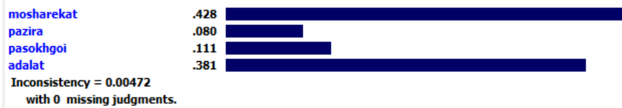
شکل (۳). ضرائب اهمیت معیارها