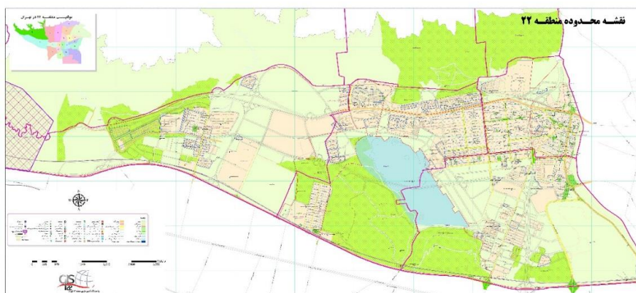
شکل (۱). موقعیت منطقه ۲۲ و نظام کاربری آن