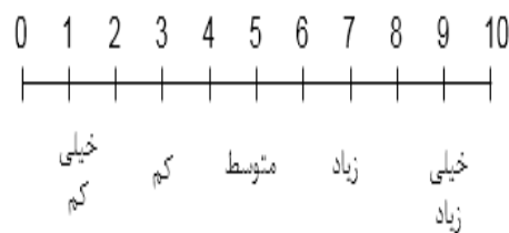
شکل (۴). مقیاس دوقطبی فاصله‌ای

پس از روشن شدن میزان اهمیت معیارها و شاخص‌ها، می‌باید امتیاز آن‌ها مشخص شود. برای تعیین امتیاز، از اطلاعات مربوط به جداول مقایسه وضع موجود منطقه (حین اجرا طرح) و طرح موردنظر استفاده شد. این اطلاعات حاصل تجزیه و تحلیل وضع موجود در منطقه و طرح CDS است که پیش‌از این بدان اشاره شد. به این صورت که پس از دریافت نظرات در قالب مصاحبه آزاد، امتیازدهی به معیارها انجام شد. برای اندازه‌گیری امتیاز اثرات مثبت و عوامل منفی بر هر شاخص و در نهایت معیار، از مقیاس دوقطبی فاصله‌ای استفاده شد. این اندازه‌گیری بر اساس یک مقیاس ۱۰ نقطه‌ای است که در آن صفر مشخص‌کننده حداقل ارزش ممکن و ۱۰ مشخص‌کننده حداکثر ارزش ممکن از اثرات عوامل مثبت بر معیارهای موردنظر است. در این مقیاس، نقطه وسط (۵) نقطه شکست مقیاس بین مطلوب و نامطلوب است، ضمناً از مقادیر ۲، ۴، ۶، و ۸ می‌توان در هنگامی استفاده کرد که حالت‌های میانه وجود دارد (زبردست و همکاران، ۱۳۹۲).