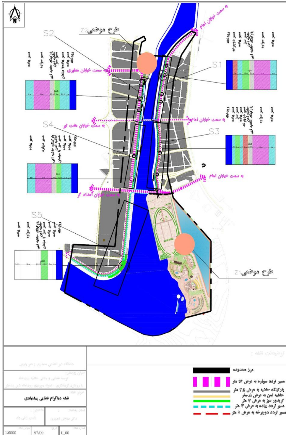
شکل (۹). دیگرام فضایی پیشنهادی برای ساحل کاشان رود (نگارنده، ۱۳۹۷)