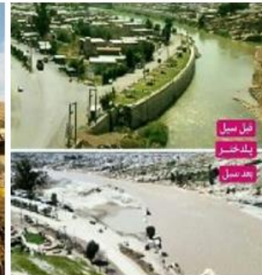
شکل (۳). رودخانه کشکان در پلدختر قبل و بعد از سیل

جهت تجزیه و تحلیل اطلاعات در این پژوهش نخست با استفاده از اطلاعات و شناخت به دست آمده از بازدیدهای میدانی و پیمایشی، عکس‌های وضع موجود و عکس‌های قدیمی سایت، نقشه‌های هوایی وضع موجود و سال‌های قبل، مطالعات و پژوهش‌های صوری گرفته در محدوده سایت و اسناد فرا دست، به بررسی و تحلیل اطلاعات کلی مربوط به محدوده مورد مطالعه پرداخته شده است. و در مرحله بعد با توجه به شاخصه‌های اصلی پژوهش پرسشنامه‌ی محقق ساخته، تنظیم شده است. که با استفاده از اطلاعات به دست آمده از پرسشنامه و به کمک برنامه SPSS به بررسی و تحلیل حوزه‌های اجتماعی و مربوط به مؤلفه عملکردی پژوهش، پرداخته و اطلاعات مربوط به این حوزه‌ها در قالب جداول و نمودار مورد بررسی و تحلیل قرار گرفته‌اند.