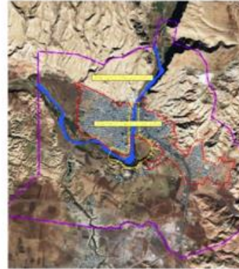
شکل (۱). محدوده شهرستان پلدختر