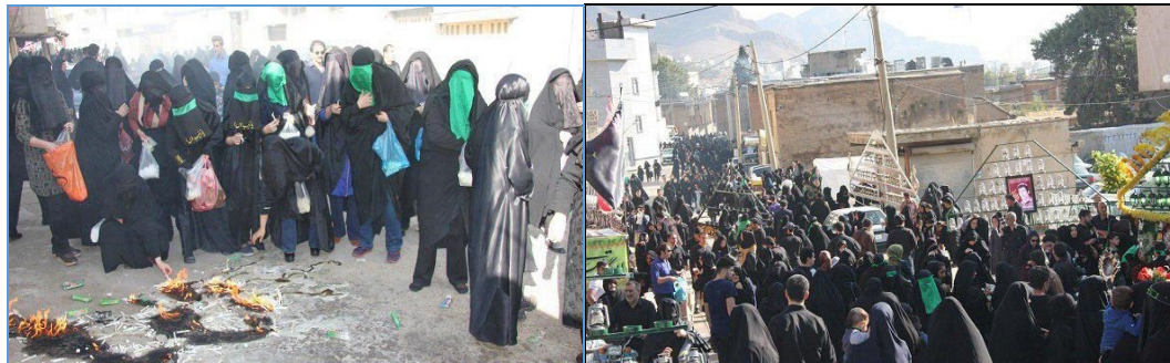
شکل (۱): افراد حاضر در مراسم چهل منبر شهرستان خرم‌آباد روز تاسوعای سال ۱۳۹۷