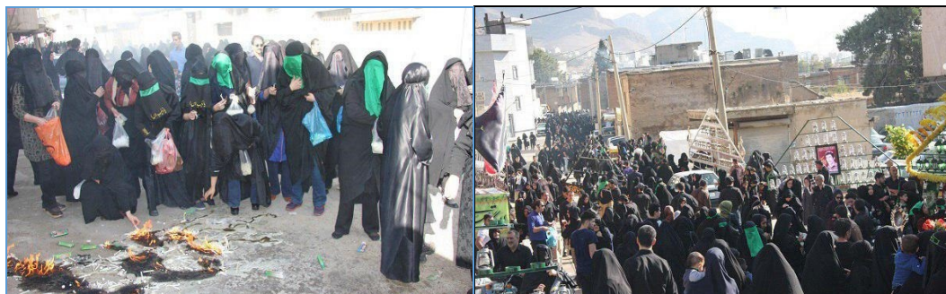
شکل (۱): افراد حاضر در مراسم چهل منبر شهرستان خرم‌آباد روز تاسوعای سال ۱۳۹۷