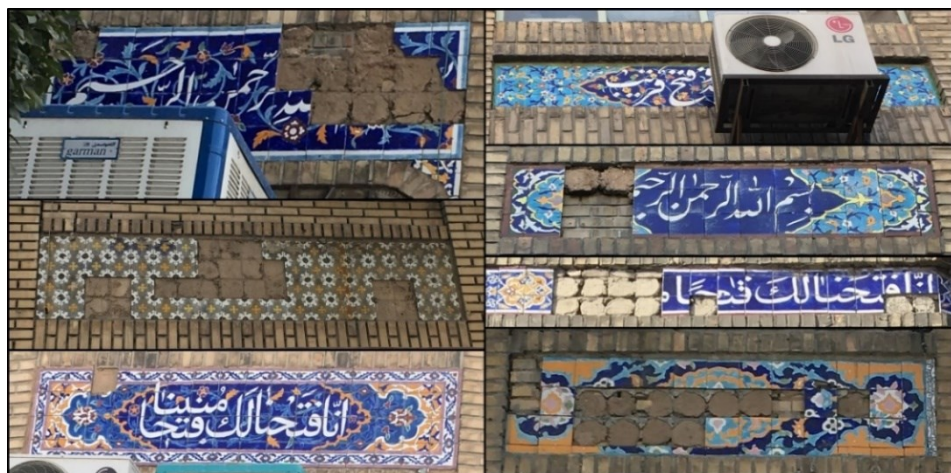
شکل (۶). نمونه‌هایی از بی‌توجهی و مرمت ن نمودن جداره خیابان امام رضا (ع)

است، هم از سوی مالکان و هم از سوی مدیریت شهری. جداره طراحی شده هویت‌مند، بومی و پایدار در سال ۱۳۵۵ اجرا شده است که امروز به واسطه دلایل مختلف رو به فراموشی است.