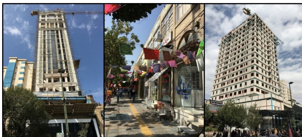
شکل (۳). جداره قدیمی و جداره جدید خیابان امام رضا (ع)

پس نباید هویت یک شهر و یا کشور را برای کسب ارزش افزوده و سود عده‌ای قلیل برای سال‌های متمادی، نامتقارن و ناهماهنگ با حرم مطهر و فرهنگ ایرانی نمود. خیابان امام رضا(ع) در اتصال با حرم مطهر است و تنها سه خیابان دیگر (شیرازی، طبرسی و نواب صفوی) با این نقش وجود دارند. البته عرض خیابان امام رضا(ع) در وضعیت کنونی از سه خیابان مذکور بیشتر است. با مقایسه گذشته و امروز خیابان امام رضا(ع) تفاوت جداره‌ها به وضوح مشخص می‌شود. امروز به جای آنکه مردم شاهد توجه مدیران شهری به چنین نمونه‌هایی و حفاظت و حراست از آن‌ها و نیز تکرار آن سیاست‌ها در دیگر نقاط شهر باشند، شاهد از بین رفتن این آثار و به وجود آمدن ساختمان‌های مرتفع در نزدیکی حرم مطهر هستند. بدون هیچ‌گونه ضابطه و قانونی و بدون توجه به جداره‌های طراحی شده چهار دهه پیش، هر طور که مالکان و صاحبان املاک مایل باشند، می‌توانند ساخت و ساز و یا مرمت کنند. در شکل (۳) جداره چهار دهه پیش با خط آسمان هماهنگ ملاحظه می‌گردد. اما امروز هتل‌هایی با ارتفاع، ابعاد، اندازه و نمای متفاوت شکل گرفته‌اند و یا در حال شکل‌گیری هستند.