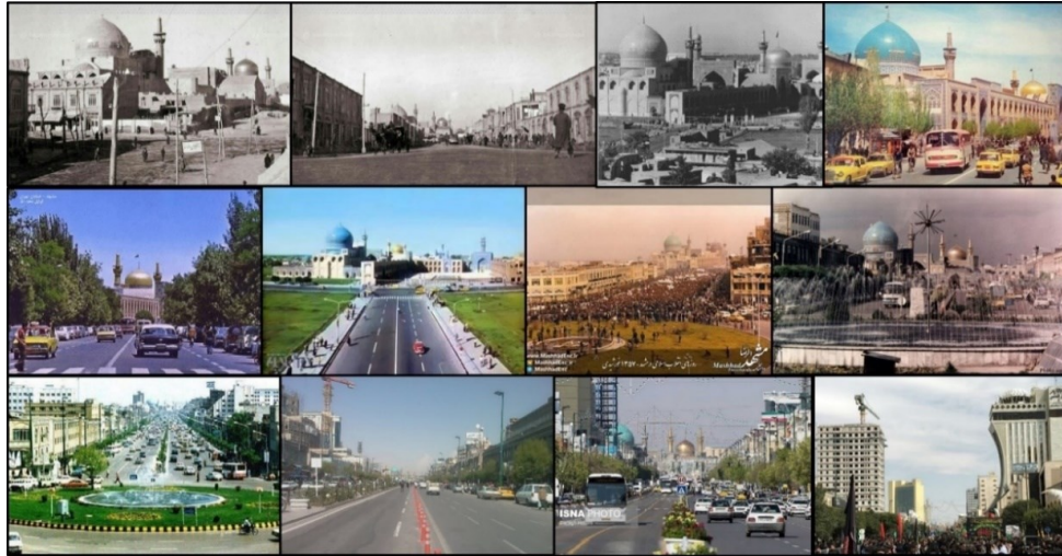
شکل (۲). منظر خیابان امام رضا (ع) در قرن اخیر

تعهد در بین مدیران، مسئولان، برنامه‌ریزان و طراحان شهری موجب این ناهماهنگی و بی‌نظمی در خیابان امام رضا (ع) شده است. در شکل (۲) منظر خیابان امام رضا (ع) در قرن اخیر آورده شده است.