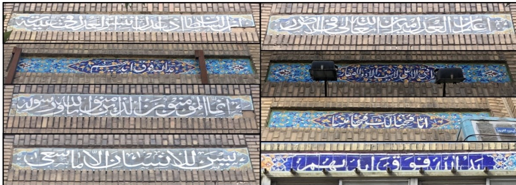
شکل (۴). نمونه‌هایی از اذکار استفاده شده در جداره خیابان امام رضا (ع)

جداره‌های خیابان امام رضا(ع) دو دسته نوشته بر روی خود دارند. یکی ذکرهایی است که با کاشی‌کاری بر روی جداره خیابان نقش بسته‌اند و دیگری نام بازارها، پاساژها و واحدهای تجاری است. همه این‌ها با ظاهری هماهنگ و هم‌خوان با یکدیگر شکل گرفته‌اند که هم فرهنگ ایرانی و هم آموزه‌های اسلامی را به نحو مطلوبی به نمایش می‌گذارند. در شکل (۵) نمونه‌ای از کاشی‌کاری‌های از این دست ملاحظه می‌گردد.