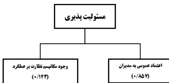
شکل (۶). وزن زیرمعیارها برای معیار مسئولیت پذیری