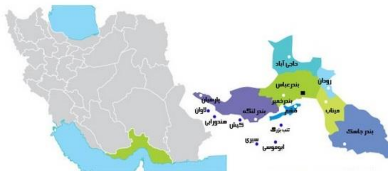
شکل (۱). موقعیت جغرافیایی جزیره کیش