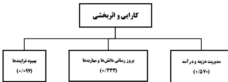
شکل (۹). وزن زیرمعیارها برای معیار کارایی و اثربخشی