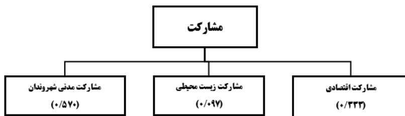
شکل (۳). وزن زیرمعیارها برای معیار مشارکت