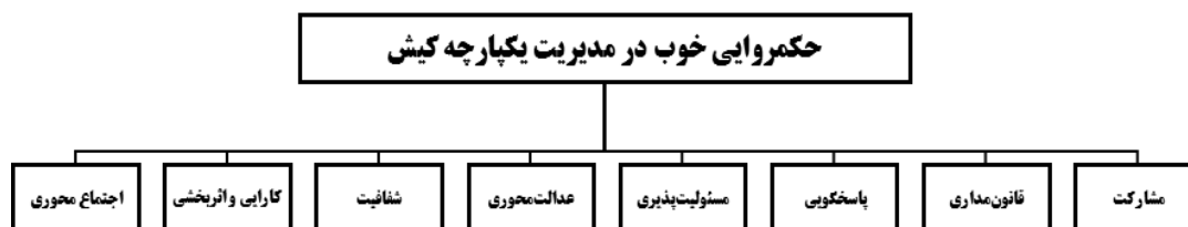
شکل (۲). معیارهای نشانگر حکمروایی خوب در مدیریت یکپارچه کیش

در این بررسی، برای سنجش حکمروایی خوب در مدیریت یکپارچه نواحی ساحلی، هشت معیار مشارکت، قانون‌مداری، پاسخگویی، مسئولیت‌پذیری، عدالت‌محوری، شفافیت، کارایی و اثربخشی و اجتماع‌محوری و بیست و پنج زیرمعیار در محدوده مطالعاتی ارزیابی می‌شود. شکل (۲) معیارهای نشانگر حکمروایی خوب در مدیریت یکپارچه کیش را نشان می‌دهد.