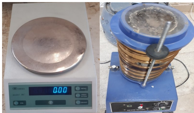
شکل (۳). دستگاه شیکر و ترازوی مورد استفاده جهت آنالیزها