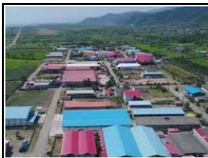
شکل (۳). چشم انداز شهرک صنعتی تالش

در این بعد، شهرک صنعتی تنها در دو معیار منظر و زیبایی، و پوشش سبز تأثیرات مثبت کم (نزدیک به متوسط) داشته و در شش معیار دیگر دارای تأثیرات منفی بوده است. به لحاظ پوشش سبز، با احداث شهرک صنعتی، بخشی از زمین های بایر به ساختمان و معبر و بخش قابل توجهی به درختکاری اختصاص داده شده است، از این رو تأثیر آن در ایجاد تاج سبز بیشتر در منطقه، مثبت تلقی شده است. فضای سبز مجموعه صنعتی نزدیک به ۱۰ هکتار می باشد (شهیدی، ۱۳۹۷). طراحی مجموعه صنعتی و منظره طرح و چشم انداز بیرونی آن از نگاه نمونه آماری هر چند در طیف کم (نزدیک به متوسط)، مثبت ارزیابی شده است شکل (۳).