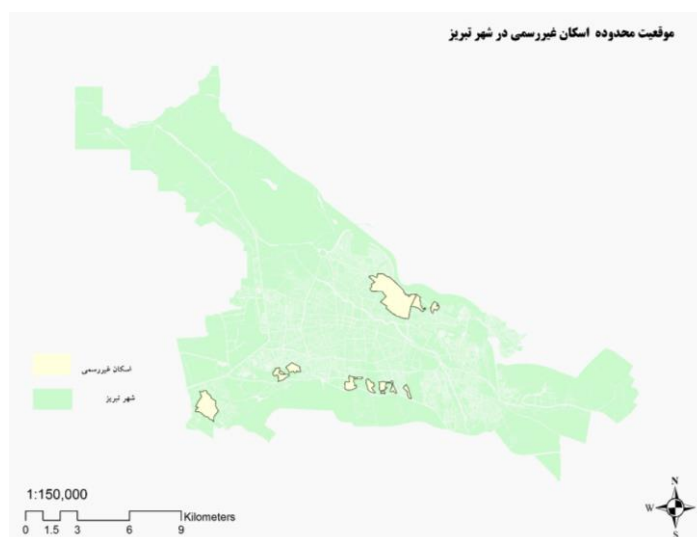
شکل (۱). موقعیت سکونتگاه‌های غیررسمی در شهر تبریز.

رواسان و آخماقیه حاشیه‌نشین محسوب می‌شوند. به لحاظ شرایط توپوگرافی، این محلات در شیب‌های بسیار تند واقع شده‌اند و بسیاری از آن‌ها دسترسی سواره ندارند و رفت‌وآمد از طریق پلکان انجام می‌گیرد. نداشتن سیستم فاضلاب و تأسیسات استاندارد از دیگر ویژگی‌های این محلات است. کیفیت مسکن این محلات بسیار پایین و حتی گاه با مصالحی چون خشت و گل می‌باشد. بافت متراکم و غالب مسکونی که بدون هیچ‌گونه فضای باز و سبز می‌باشد در این مناطق به چشم می‌خورد (شکل ۲).