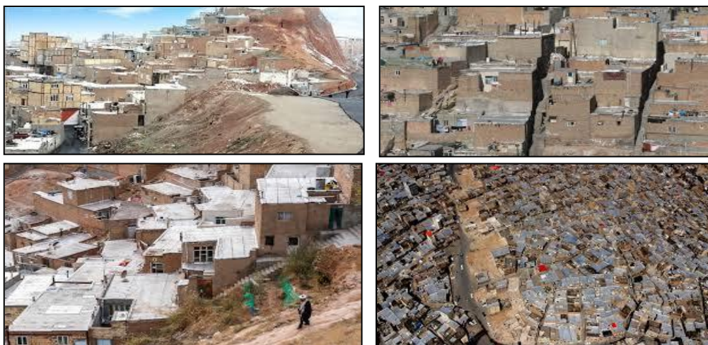
شکل (۲). تصاویری از سکونتگاه‌های غیررسمی شهر تبریز