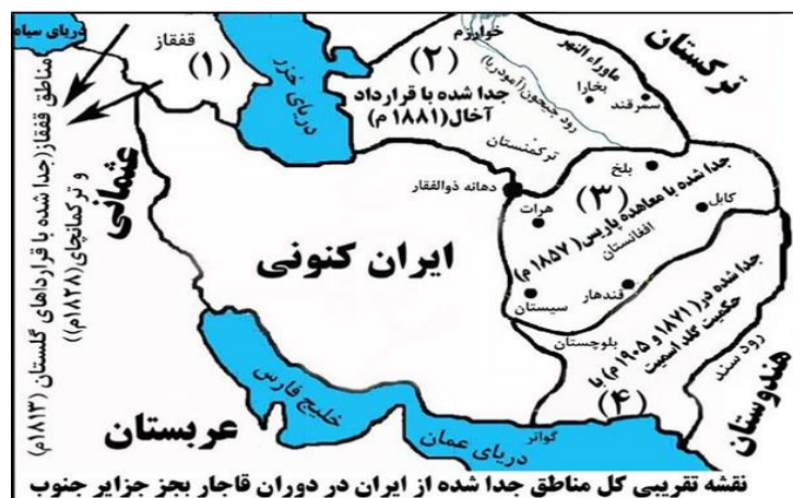
شکل (۲). تغییرات جغرافیایی در مرزهای شمال و شمال شرق بعد از قرارداد آخال، گلستان و ترکمنچای

۹۰-۹۱). روس‌ها در ابتدا نواحی شمال غربی ایران را تصرف نمودند و از ضعف ساختاری ارتش ایران و عقب‌ماندگی آن نهایت استفاده را برده و طی دو قرارداد گلستان ۱۱۹۲ ش برابر با ۱۸۱۳ میلادی و ترکمن‌چای برابر با ۱۸۲۸ م/۱۲۰۷ ش موفق به تصرف نواحی گسترده‌ای از ایران شدند و عملاً تغییرات جغرافیایی در مرزها و ژئوپلیتیک شمال ایران به وجود آمد. این تغییرات در شکل (۲) نشان داده شده است.