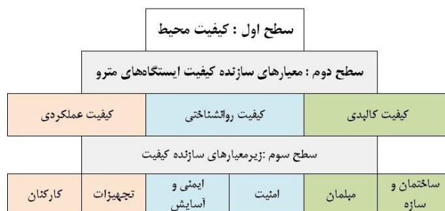
شکل (۲). مدل تجربی کیفیت محیطی ایستگاه‌های مترو

جهت دستیابی به اطلاعات ابتدا اسناد و مدارک، آمار و اطلاعات، متون فارسی، لاتین و ... از طریق مراجعه به کتابخانه، استفاده از نشریات تخصصی، منابع اینترنتی گردآوری شد. مدل تجربی سنجش کیفیت محیط دارای ساختاری سلسله‌مراتبی بوده و متشکل از معیارها و جزمعیارهایی است که در سطوح مختلف آن قرار می‌گیرند. در این جزمعیارهای سطح آخر مدل، مبنای تنظیم پرسشنامه تحقیق قرار گرفته و براساس میزان رضایتمندی یا نارضایتی ساکنین محیط موردنظر امتیازدهی می‌شوند. معیارهای اصلی جهت سنجش در سه دسته شامل معیارهای کالبدی و عملکردی و روان‌شناختی قرار گرفته که سطح دوم از معیارها را تشکیل می‌دهند. معیارها با استفاده از میزان رضایتمندی افراد و با استفاده از مدل‌های تحقیقات مشابه به‌دست آمده‌اند.