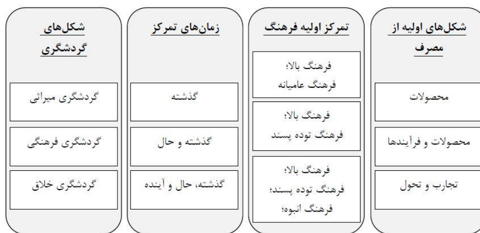
شکل (۲). ویژگی‌های گردشگری فرهنگی در کنار میراث فرهنگی و گردشگری خلاق

با این حال بیشتر موارد ذکر شده مبتنی بر محصول است (OECD, 2009)، به همین دلیل به هیچ طریقی نمی‌توان جلوی کالایی شدن فرهنگ را گرفت چرا که در اهمیت نقش محصولات فرهنگی در توسعه گردشگری جهت کسب سود بالاتر در مناطق مختلف هیچ شکی وجود ندارد. تجارب فرهنگی می‌تواند منجر به افزایش محصولات فرهنگی و همچنین جذب گردشگران جدید به منطقه شود که در این صورت جذب بازدیدکنندگان بر اساس عوامل انگیزشی مبتنی بر فرهنگ صورت می‌گیرد. گزارش سازمان همکاری اقتصادی و توسعه سازمانی در سال ۲۰۰۹ که نشان‌دهنده تأثیر فرهنگ بر روی گردشگری است، بیان می‌کند که گردشگری فرهنگی می‌تواند نقش عمده‌ای در توسعه مناطق مختلف، گرد هم آوردن مردم با سنت‌های متعدد و به اشتراک‌گذاری آداب و رسوم و ارزش‌ها داشته باشد. یکی از مهم‌ترین مشکلات در این زمینه از نظر راج این است که: اصطلاح «فرهنگ» به شدت در طول دو دهه گذشته مورد بحث قرار گرفته و هیچ تعریف روشن و مورد قبولی از مفهوم آن توسط جامعه به عنوان یک کل نشده است. این مورد ارتباط نزدیکی با هویت ملی ما دارد که مردم را در سازمان‌های اجتماعی، محلی و ملی مانند دولت‌های محلی، نهادهای آموزش و پرورش، جوامع مذهبی، کار و فراغت و تفریح قرار می‌دهد (Raj, 2012)؛ در نتیجه در چنین شرایطی چگونه فرهنگ می‌تواند یک ابزار و اهرمی در توسعه گردشگری محسوب شود. پس اولین گام در توسعه گردشگری فرهنگی در یک جامعه، تعریف روشنی از فرهنگ آن جامعه و محصولات فرهنگی آن است. رایج‌ترین روش صورت گرفته در برخورد با گردشگری فرهنگی کاهش ناملموس یک محصول در بازار و ایجاد تمایز بین محصولات و تبدیل آنها به محصولات مختلف و مرتبط با مفاهیم گردشگری میراث فرهنگی، گردشگری فرهنگی و گردشگری خلاق است. شکل (۲).