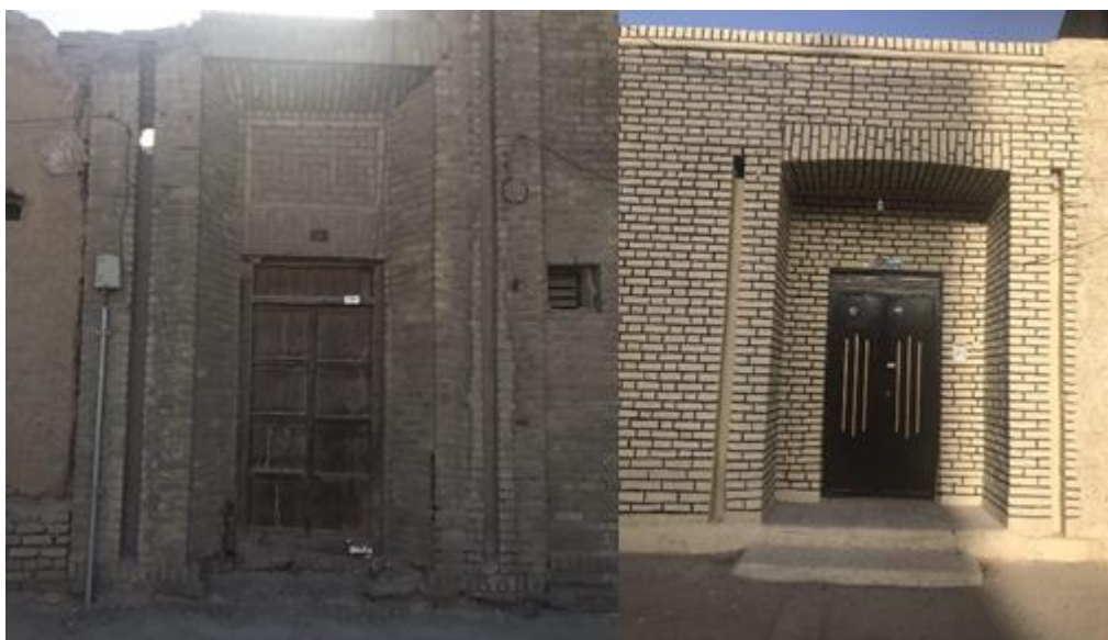
شکل (۲). سردر و تزیینات بنای مسکونی دوره پهلوی در شهر زاهدان (محقق، ۱۴۰۰)

بازشناسی سردر بناهای دوره پهلوی در شهر زاهدان بر اساس تزیینات نما جمع‌بندی بررسی سردر بناهای دوره پهلوی در شهر زاهدان بر اساس فراوانی تعداد بناها نشان می‌دهد که از ۸ بنای بررسی شده، همه آن‌ها جز بناهای با سبک معماری سنتی است؛ چراکه شکل، نقوش و مصالح به‌کاررفته در آن‌ها به‌خوبی این مطلب را تأیید می‌نمایند. مصالح غالب آجر، گچ، آهک و رس بوده که در تمامی سردرها قابل مشاهده است. نوع کتیبه به‌کاررفته در سردرها نیز آجرکاری ساده بوده است. تزیینات نیز به‌صورت ساده و جناغی و در برخی موارد تزیینات رگ چین و پیچ ماری نیز دیده می‌شود. نقوش خاصی نیز دیده نمی‌شود و بیشتر نقوش ساده و با استفاده از آجر انجام گرفته است. وجود تاج و طاق نیز از دیگر خصوصیات تزیینی سردر بناهای دوره پهلوی در شهر زاهدان است؛ بنابراین بررسی سردر بناها بر اساس تزیینات نما نشان می‌دهد که تزیینات مبتنی بر سبک معماری سنتی بوده و بیشتر نقوش، اشکال و کتیبه‌های به‌کاررفته در سردر بناها شامل آجرکاری، استفاده از طرح‌ها و اشکال ساده بوده و نقوش باستانی و غربی به‌کار نرفته است. در حقیقت آجر و استفاده از مواد سازگار با اقلیم منطقه با طراحی‌های ساده و در بسیاری از موارد بدون طرح در سردرها، گونه غالب محسوب می‌شود؛ بنابراین گونه غالب سردر بناهای شهر زاهدان، از نوع معماری سنتی و به‌صورت ساده و تزیینات نیز مبتنی بر آجر بوده است (جدول (۳)).