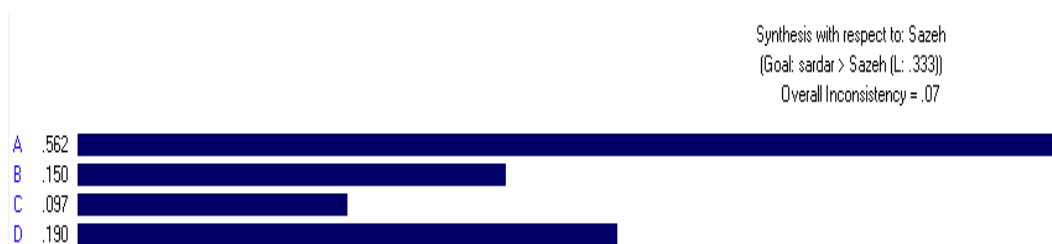
شکل (۳). اولویت‌بندی ویژگی‌های کالبدی سردر بناها (زیرمعیارها) دوره پهلوی در شهر زاهدان

اولویت‌بندی ویژگی‌های تزئینی سردر بناهای دوره پهلوی در شهر زاهدان (زیرمعیارها) اولویت‌بندی ویژگی‌های تزئینی سردر بناهای دوره پهلوی در شهر زاهدان نیز بررسی شد. در این زمینه نیز چهار ویژگی مورد تأکید بوده است که شامل کتیبه آجری ساده، تزئینات (ساده، جناغی، پیچ ماری و رگ چین)، تاجدار ساده با طاق گرد و جناغی و آجرکاری ساده با چین افقی است. تحلیل دیدگاه کارشناسان نشان می‌دهد که ویژگی استفاده از تزئینات ساده، جناغی، پیچ ماری و رگ چین با وزن ۰/۳۷۶ به‌عنوان مهم‌ترین ویژگی یا شاخص تزئینی سردر بناها شناخته شده است. در حقیقت این ویژگی، سردر بناهای دوره پهلوی در شهر زاهدان را متمایز می‌نماید. همچنین استفاده از کتیبه‌های آجری ساده نیز با وزن ۰/۲۴۱ در رتبه دوم اهمیت قرار گرفته است که در بیشتر بناها و سردر بناها قابل‌مشاهده است و نقش مهمی را در تزئینات سردرها ایفا می‌کند. تاجدار بودن ساده با طاق گرد و جناغی با وزن ۰/۲۳۱ در رتبه سوم و آجرکاری ساده با چین افقی نیز با وزن ۰/۱۵۲ در رتبه چهارم این اولویت‌بندی و اهمیت قرار گرفته‌اند؛ بنابراین استفاده از آجر، تاجدار بودن، استفاده از طاق‌های گر و جناغی و همچنین تزئینات غالب با آجر و به‌صورت ساده، غالب ویژگی‌های تزئینی سردر بناهای دوره پهلوی در شهر زاهدان محسوب می‌شود. جدول (۶) و شکل (۴) اولویت‌بندی ویژگی‌های تزئینی سردر بناها (زیرمعیار) دوره پهلوی در شهر زاهدان را با روش AHP نشان می‌دهد.