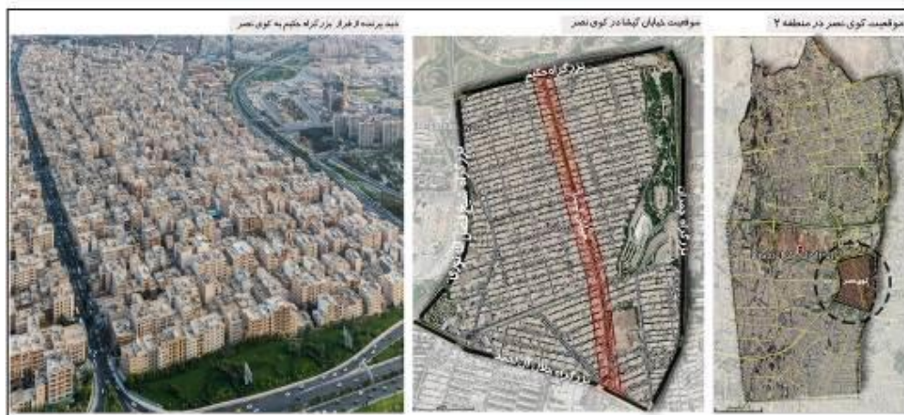
شکل (۱). نقشه معرفی محدوده خیابان گیشا

ساختار اصلی منظم و شطرنجی محله کوی نصر واقع در منطقه دو شهرداری تهران بر اساس خیابان گیشا شکل گرفته و غالب کاربری‌های تجاری محلی و فرامحلی در حاشیه این خیابان مکان یافته‌اند. خصلت تجاری غالب در این محور ۱۶۰۰ متری باعث شده که حضور مردم با فراغت و تفریح نیز همراه باشد و از این لحاظ خیابان گیشا نقشی فرامحله‌ای یابد. وجود کاربری‌های جاذب سفر در سطح منطقه و فرامنطقه (مجموعه برج میلاد، بوستان گفتگو، محل دائمی نمایشگاه‌های بین‌المللی شهرداری تهران و مرکز خرید گیشا) در نزدیکی این خیابان، سبب تمایز ساختار کالبدی و عملکردی آن شده است (آزادی و دیگران؛ ۱۳۹۶). شکل (۱) موقعیت خیابان گیشا را نشان می‌دهد.