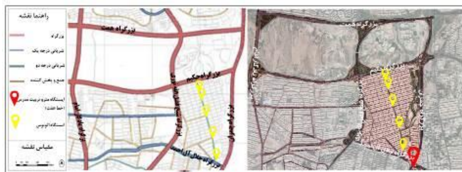
شکل (۴). نقشه مسیر دسترسی عمومی محدوده کوی نصر

شاخص دسترسی به مراکز حمل‌ونقل عمومی با بار عاملی ۰.۷۵۱ در عامل اقتصاد زمین و توزیع فعالیتی اثرگذار است. نقشه زیر مسیر دسترسی‌های مترو و اتوبوس محدوده کوی نصر را نشان می‌دهد. وجود ایستگاه‌های مترو و ایستگاه اتوبوس در کوی نصر و اطراف آن نشان از وضعیت مطلوب دسترسی در محدوده دارد. این شاخص با شاخص‌های قیمت مسکونی و تجاری در ارتباط است. به‌گونه‌ای که بهبود دسترسی و حمل‌ونقل عمومی در این محدوده می‌تواند سبب افزایش سفرها، افزایش حضور پذیری مردم و در نهایت عاملی تأثیرگذار در قیمت تجاری و مسکونی در این محله و توجیه‌پذیری افزایش فعالیت‌های اقتصادی و تغییر کاربری‌ها باشد.