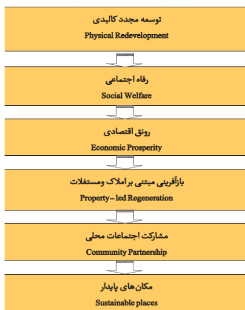
شکل (۱). تعامل بازآفرینی و توسعه پایدار مأخذ: (کولانتونیو و دیکسون، ۲۰۱۱، ۶).

توسعه پایدار دارد. نقطه برخورد و تلاقی این دو مفهوم با یکدیگر بر منطقی دیدن توسعه و نیل به برآیند مثبت اثرات مختلف عوامل اجتماعی- فرهنگی، محیطی و اقتصادی هست (پوراحمد و همکاران، ۱۳۹۶، ۱۷۶). بدین ترتیب به تدریج نظریه شهرهای پایدار با دیدگاه بازآفرینی مرتبط گردیده است. در این راستا تعاریفی از بازآفرینی شکل گرفت که به مؤلفه‌های پایداری نزدیک شده است. اساس بازآفرینی شهری پایدار، تعاملات اجتماعات محله‌ای و دستیابی به توافق عمومی است. بدین معنی که در بازآفرینی شهری گونه‌های جدید نهادی شکل می‌گیرند که سعی دارند سیاست‌های بازآفرینی اجتماع مدار را به صورت جامع و یکپارچه و از پایین به بالا تبیین کنند به صورتی که همه افراد ذی‌نفع را در بر بگیرد (فرجی ملائی، ۱۳۸۹، ۱۵). با وجود ظهور مفاهیم نو در بازآفرینی و توسعه پایدار، هماهنگی کمی بین این دو؛ خصوصاً بازآفرینی اقتصادی در مقایسه با پایداری برای نیل به اهداف بازآفرینی شهری وجود داشته است. تعامل مابین دو مفهوم بازآفرینی و توسعه پایدار در شکل (۱) به تصویر کشیده شده است.