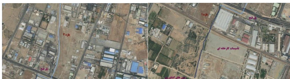
شکل (۵). تصویر هوایی مسیر بازه ۲