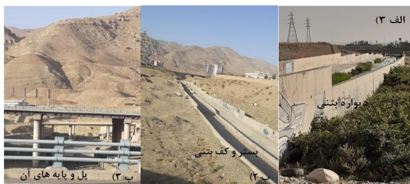
شکل (۹). ادامه: الف ۳) تصویر میدانی مسیر بازه ۶. ب ۲) و ب ۳) تصاویر میدانی مسیر بازه ۷.

بازه ۸ از ابتدای شهرک بالادست اتوبان شهید خرازی شروع شده و تا بعد از مناطق مسکونی امتداد دارد. از نظر شاخص عملکردی در این بازه پیوستگی طولی با تغییرات کم وجود دارد که جلوی عبور سیلاب را نمی‌گیرد و اشکال بستری سازگار با شیب دره هستند و دیواره‌های در اطراف رودخانه وجود ندارد و رسوبات ریزدانه فراوان در بخش‌های مختلفی از بازه وجود دارد و از نظر شاخص مصنوعی دارای تغییرات جریان و تغییرات دبی مشخصی می‌باشد و تغییرات مصنوعی در کمتر از ۱۰