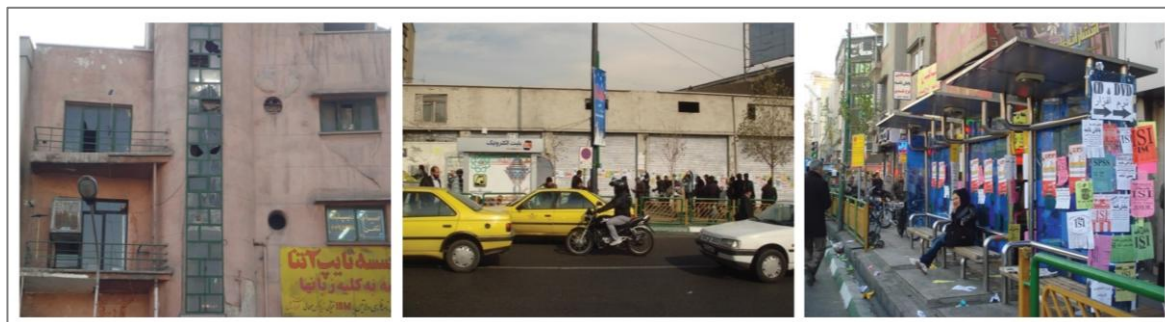
الف. وجود آلودگی های بصری فراوان، ب. وجود جداره های بدون فعالیت، ج. وجود پنجره شکل (۲). برخی از تصاویر حاصل از مشاهدات میدانی