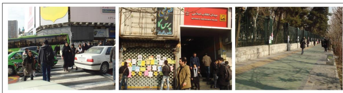
الف. جداره یکنواخت و فاقد کاربری دانشگاه و عدم امنیت در شب، ب. عدم خوانایی ایستگاه مترو به دلیل آشفتگی در نما، ج. تداخل سواره و پیاده شکل (۳). برخی از تصاویر حاصل از مشاهدات میدانی

مطابق یافته‌های حاصل شده از چک لیست کارشناسان، شرایط محیطی سایت که موجبات وقوع جرم را فراهم می‌سازند، عبارت‌اند است از: