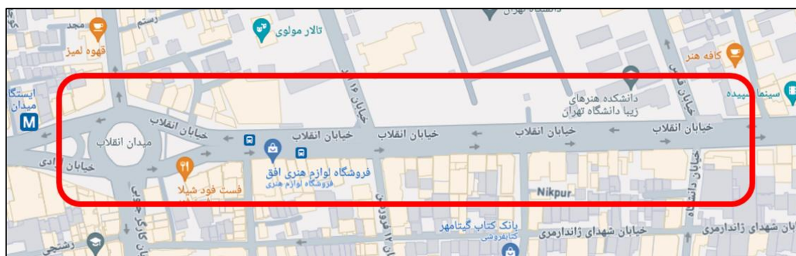
شکل (۱). محدوده مورد مطالعه در این پژوهش

خیابان انقلاب اسلامی یکی از خیابان‌های مهم و مرکزی شهر تهران است. (شکل ۱). این خیابان به علت واقع شدن دانشگاه تهران در کنار آن و نیز وجود فروشگاه‌های بزرگ کتاب و نشریات از خیابان‌های مهم تهران محسوب می‌گردد. محدوده مورد مطالعه این پژوهش، حدفاصل میدان انقلاب تا خیابان دانشگاه از این خیابان را شامل می‌شود که حال و هوای دانشگاهی و فرهنگی بر آن غالب است. لازم به ذکر است محدوده مورد مطالعه مشتمل بر بخش سواره‌رو و پیاده‌رو خیابان می‌باشد. طی پایش میدانی و مصاحبه با کاربران این محدوده مشخص گردید، بیشتر افراد از دانشجویان گرفته تا خریداران کتاب و مغازه‌داران و یا حتی رهگذران، بر عدم امنیت نسبی این خیابان اذعان دارند. ۶۲ درصد از افرادی که در مصاحبه مشارکت کردند، به وجود جرمی نظیر کیف‌قاپی، دزدی و مزاحمت خیابانی اشاره داشتند. شکل ۱ محدوده مورد مطالعه در پژوهش پایش رو را نشان می‌دهد. جداره شمالی این بخش از خیابان انقلاب در منطقه ۶ از مناطق ۲۲ گانه تهران و ضلع جنوبی آن جزء منطقه ۱۱ می‌باشد. وجود دانشگاه تهران به عنوان یک کاربری در مقیاس ملی و کتاب‌فروشی‌ها و انتشاراتی‌های مقابل آن سبب جذب جمعیت از سراسر ایران به این نقطه گشته و بر اهمیت این مکان می‌افزاید.