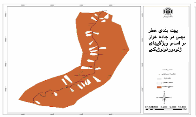
شکل شماره ۲ نقاط بهمن خیز مسلط بر جاده هراز (امام زاده هاشم تا هردورود

این نقشه را با استفاده از بازدیدهای میدانی و برداشت حدود ده نقطه توسط GPS از جاهایی که با توجه به معیارهای ژئومورفولوژیکی، اقلیمی، و شواهدی مبنی بر وجود تونل‌ها و بهمن‌گیرهای موجود، احتمال وقوع بهمن وجود داشت تهیه کرده‌ایم (شکل شماره ۲).