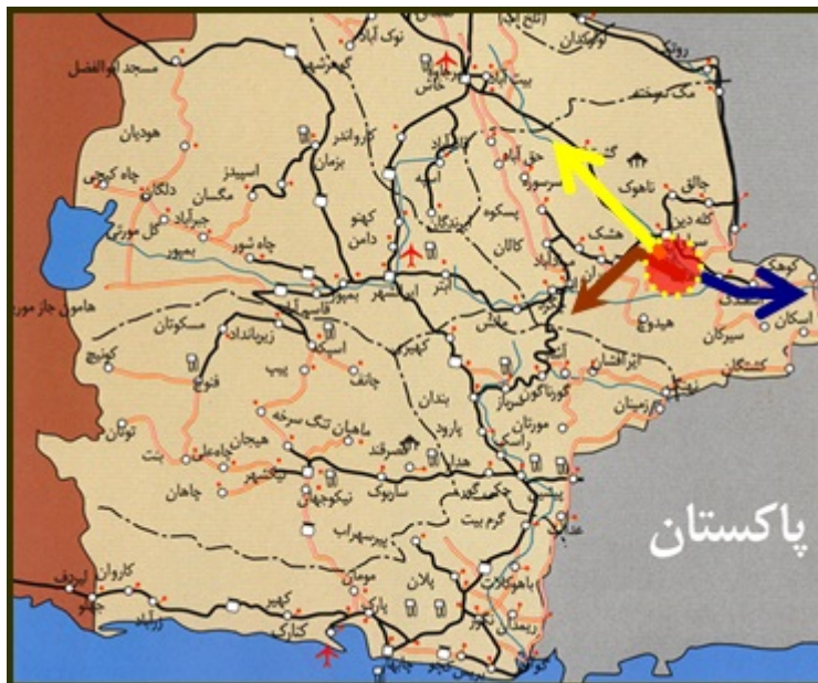
شکل (۲) نمایی از محورهای اصلی منطقه نمونه گردشگری کلپورگان با نواحی پیرامونی