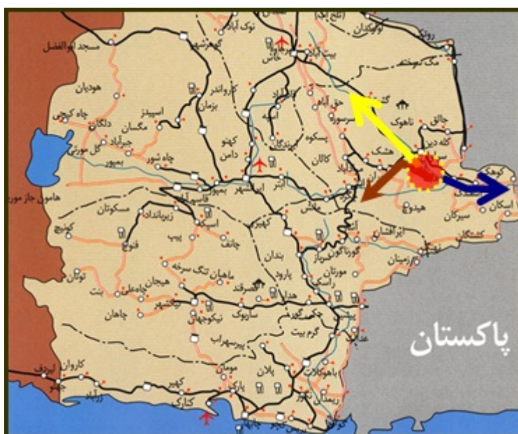
شکل (۲) نمایی از محورهای اصلی منطقه نمونه گردشگری کلپورگان با نواحی پیرامونی