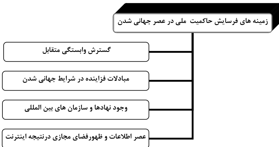
شکل (۳) زمینه های فرسایش حاکمیت ملی در عصر جهانی شدن (ترسیم از: نگارندگان)

قابل پیش بینی در جهت ایفای نقش خود به عنوان یک نهاد تأثیر گذار تداوم پیدا خواهد کرد. اما وجود یا فقدان حاکمیت به صورتی هر چه کمتر ویژگی تعیین کننده ساختار یا شیوه عمل دولت خواهد بود (کلارک، ۱۳۸۲: ۱۷۳). (شکل ۳)