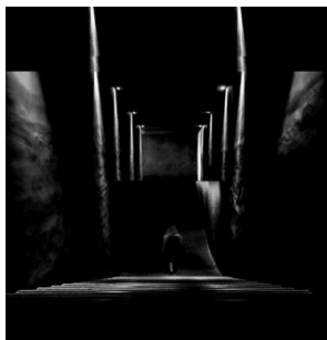
شکل ۲. شبیه‌سازی راه‌پله منتهی به دهلیز نمور در داستان شازده احتجاب

در داستان شازده احتجاب ، در پایان داستان، عنصر پله در کنار فضاهایی چون دهلیز و سردابه در خلق فضایی ابهام آمیز بین خواب و بیداری و مرگ و زندگی نقش مؤثری دارد. رمان شازده احتجاب با حرکت رو به پایین و نزولی شازده از پله‌ها و حضور در سردابه‌ای سرد و تاریک، که نشانه‌ای از مرگ و ناخودآگاهی است، به پایان می‌رسد. پله‌ها نمور و بی‌انتهای بود و شازده که می‌دانست نتوانسته است، که پدر بزرگ را نمی‌شود در پوستی جا داد، که فخرالنساء... از آن همه پله پایین‌تر و پایین‌تر می‌رفت، از آن همه پله که به دهلیز نمور می‌رسید و به آن سردابه زمهریر و به شمد و خون و به آن چشم‌های خیره‌ای که بود و نبود (گلشیری، ۱۳۶۸: ۹۵).