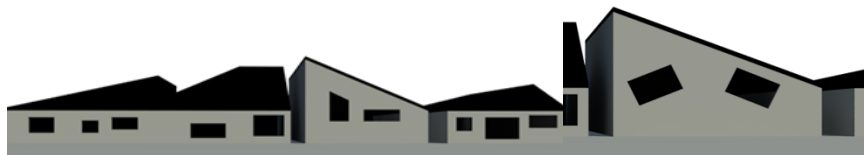
شکل ۱. شبیه‌سازی خانه‌ها و پنجره‌ها در داستان بوف‌کور

پنجره‌ها به چشم‌های گیج کسی که تب هذیانی داشته باشد شبیه بود... (هدایت، ۱۳۵۶: ۳۴). خانه‌های عجیب و غریب به شکل‌های بریده‌بریده هندسی با پنجره‌های متروک سیاه، کنار جاده رج کشیده بودند، ولی بدنه دیوار این خلنه مانند کرم شبتاب تشعشع کدر و ناخوشایندی از خود متصاعد می‌کرد... (همان، ۴۱).