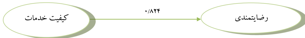
شکل ۱. تأثیر رگرسیونی متغیر کیفیت خدمات بر رضایتمندی

پروورش اندام در حد کم، ۴۶/۶ درصد در حد متوسط و ۴۲/۵ درصد در حد زیاد ارزیابی شده است. همچنین، نتایج نشان داد (شکل ۱ و جدول ۱) در مجموع، متغیر کیفیت خدمات پیش‌بین معناداری برای رضایتمندی مشتریان محسوب می‌شود ( p < 0.01 )، \beta = 0.824 .