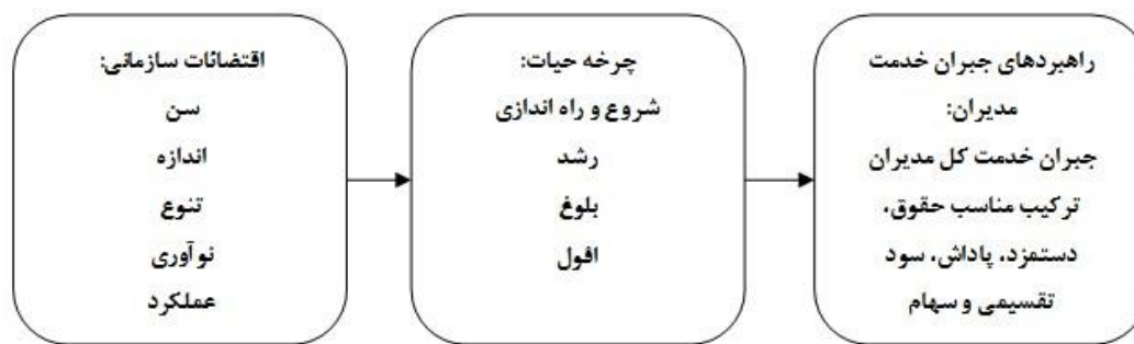
شکل شماره (۲)، چارچوب اقتضایی جبران خدمت مدیران (۵).

در حقیقت فرض اساسی پژوهش حاضر آن است که بنابر پویایی و دگرگونی ذاتی چرخه حیات سازمان، هیئت مدیره و مدیریت عالی برای جبران خدمت مدیران خود باید چگونه تصمیم گیری نماید تا مدیران همواره راضی و پر انگیزه باشند و عملکرد مطلوب از خود نشان دهند و از طرف دیگر این سبک جبران خدمت برای وضعیت کنونی سازمان بهترین تصمیم باشد. از این رو چارچوب اقتضایی ارتباط میان جبران خدمت مدیران و چرخه حیات سازمان را می توان در قالب شکل زیر نشان داد.