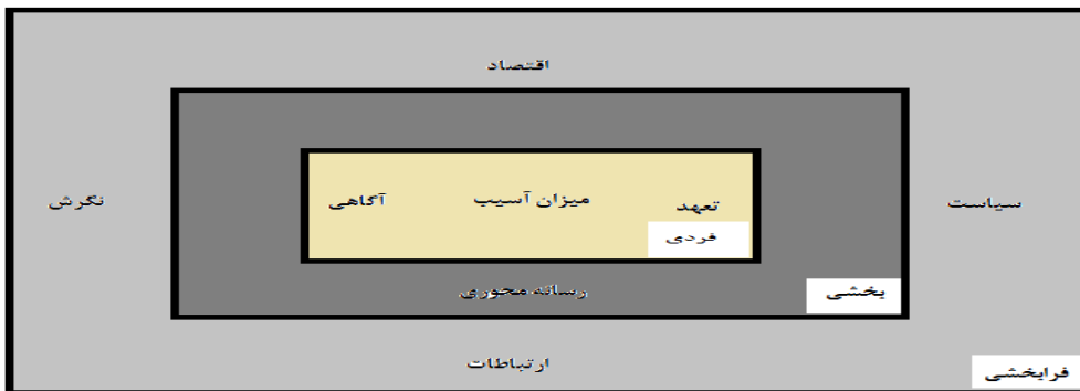
شکل ۱- بسترهای مسئولیت اجتماعی ورزشکاران

در این پژوهش در مرحله کدگذاری انتخابی به روش اشتراوس و کوربین، با توجه به نقش مفاهیم به دست آمده در تبیین فرایند طراحی الگوی مسئولیت پذیری اجتماعی ورزشکاران در قالب راهبردها، شرایط زمینه‌ای (داخلی)، شرایط مداخله گر (خارجی) و پیامدها به هم مرتبط شدند که در نمودار ۱ نشان داده شده است.