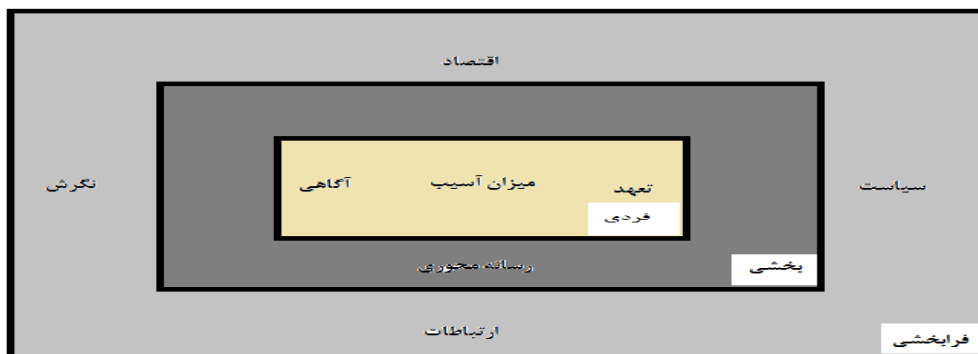
شکل ۱- بسترهای مسئولیت اجتماعی ورزشکاران

در این پژوهش در مرحله کدگذاری انتخابی به روش اشتراوس و کوربین، با توجه به نقش مفاهیم به دست آمده در تبیین فرایند طراحی الگوی مسئولیت پذیری اجتماعی ورزشکاران در قالب راهبردها، شرایط زمینه‌ای (داخلی)، شرایط مداخله گر (خارجی) و پیامدها به هم مرتبط شدند که در نمودار ۱ نشان داده شده است.