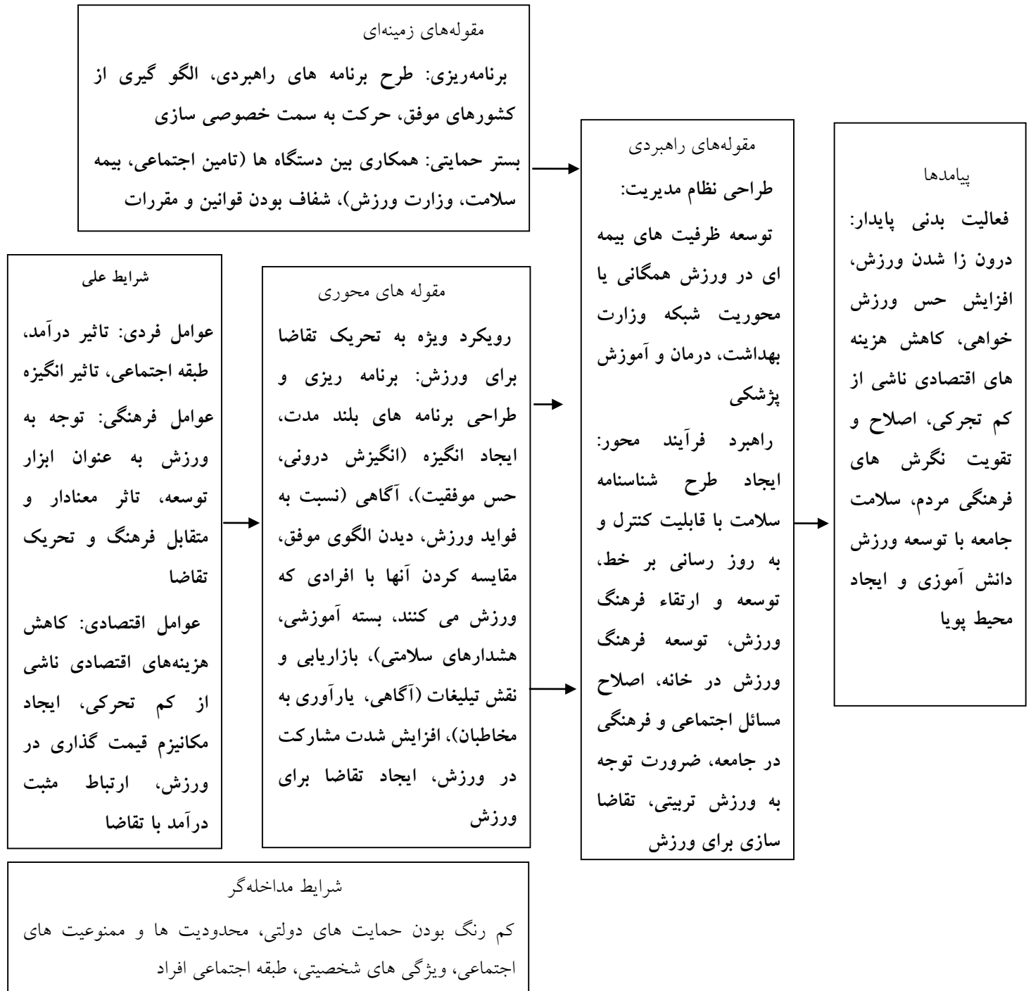
شکل ۱. الگوی تحریک تقاضا برای ورزش در جامعه ایرانی

گزاره‌های حکمی (قضایای) پژوهش گزاره‌های حکمی یا قضایای نظریه همان قضایای فرضیه‌هایی هستند که روابط بین مقوله‌ها، را با پدیده محوری بیان می‌کنند (۲۲). بر پایه مؤلفه‌های کدگذاری محوری این تحقیق، قضایای زیر به دست می‌آیند: