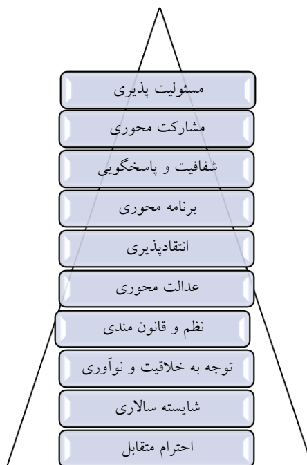
شکل ۱: ارزش‌های کلیدی حاکم بر دانشکده

از دیگر یافته‌های پژوهش حاضر که کمتر در مطالعات راهبردی به آن پرداخته می‌شود تعیین محورهای رشد و توسعه است. در این مطالعه ۴ محور با رویکرد دانشگاه‌های نسل چهارم تعیین شد که در ادامه کلیه تحلیل‌ها بر پایه این ۴ محور قرار گرفته است (شکل ۴).